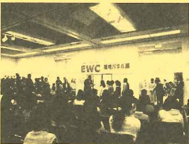
期間最終日の表彰式

このほか、食べ物や自然のことについて 調べた作品、クラスや学年 みんなで取り組んだ作品なども たくさん入賞しました!